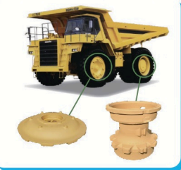
【 建せつ機械部品 】 大型トラックの車輪の丸い大きな部品も作っています。