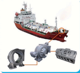
【 船ぱく部品 】 船のかん板にある大きな機械の部品も作っています。