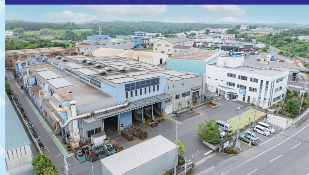
株式会社伊藤铸造鉄工所

「 铸造 （ちゅうぞう）」とは、砂で作った型に、高熱でドロドロにとかした鉄を流しこんで形をつくる方法だよ。お寺のかねや大ぶつ様などもこの方法で作られているんだ。ふくざつな形のものや大きなものも作れるから電車や船の部品にも使われているよ。