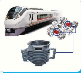
【 鉄道部品 】 電車のモーターの一部、ステーターフレームを作っています。